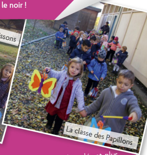
La classe des Papillons