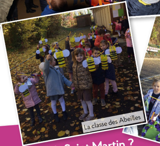
La classe des Abeilles