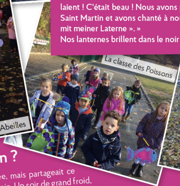
La classe des Poissons