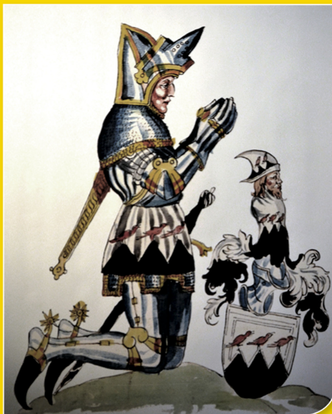
Membre de la famille Waldner représenté en prière et tombé en 1386 à Sempach (Suisse) aux côtés du Duc Léopold d'Autriche.

Bel hommage à l'expansion économique du bourg favorisée par les Waldner que celui de la municipalité de Sierentz en nommant en 1985 une des artères principales du nouveau quartier "rue Waldner".