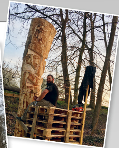
*Chantier en cours