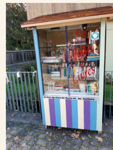
La boîte à livres du Péri-scolaire...

Les ateliers du conseil participatif citoyen ont travaillé. Certaines propositions ont été mises en œuvre et sont déjà bien visibles, d'autres ont été soumises au Conseil Municipal : voilà une petite synthèse du travail des différents ateliers du Conseil Participatif Citoyen (CPC)*.