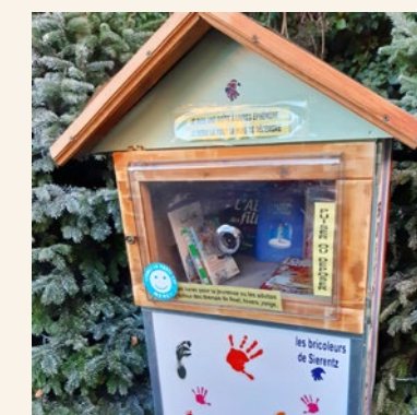
Et leur « petite sœur » : la boîte éphémère NB : Elle était présente tout le temps de l'Avent. Elle va réapparaître bientôt pour un autre thème à un autre endroit : guettez-la.