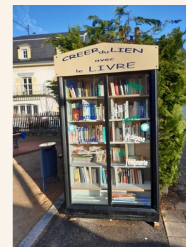
... et celle de la Bascule