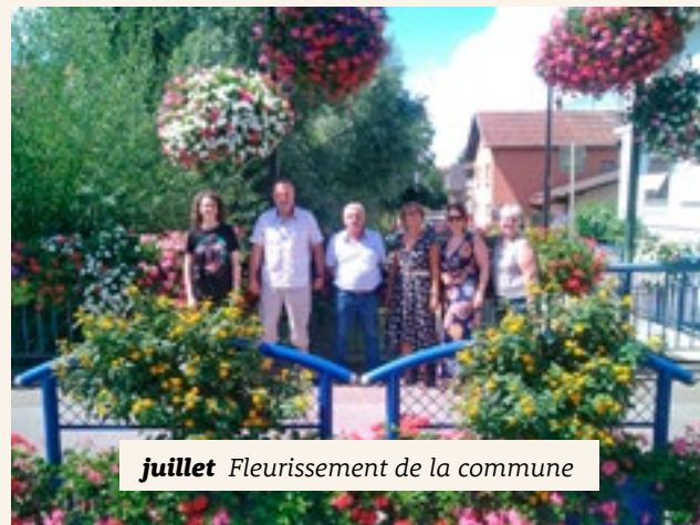
juillet Fleurissement de la commune