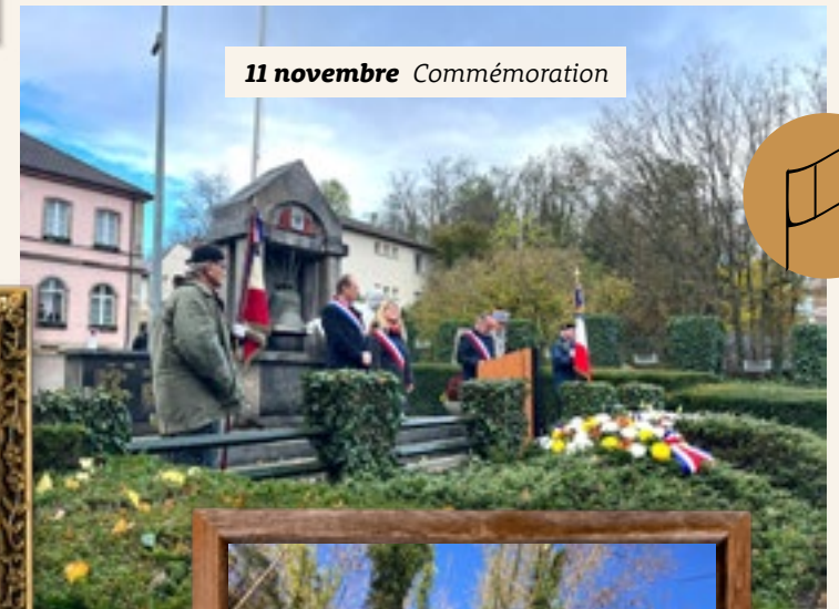
11 novembre Commémoration