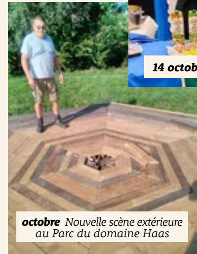
octobre Nouvelle scène extérieure au Parc du domaine Haas