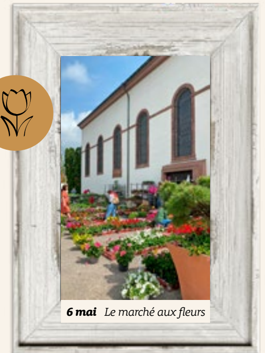
6 mai Le marché aux fleurs