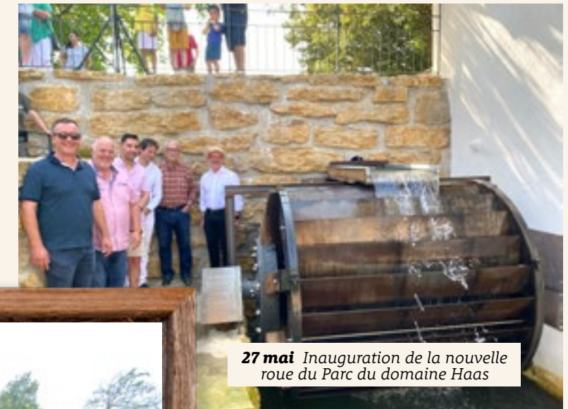
27 mai Inauguration de la nouvelle roue du Parc du domaine Haas