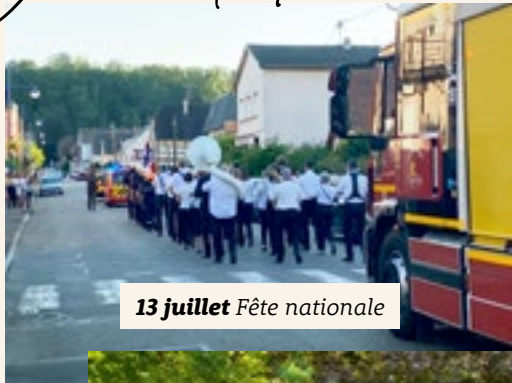
13 juillet Fête nationale