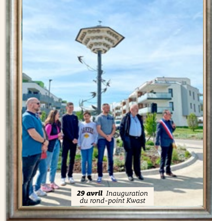
29 avril Inauguration du rond-point Kwast