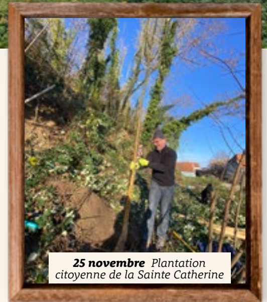
25 novembre Plantation citoyenne de la Sainte Catherine