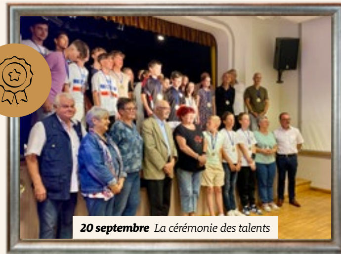
20 septembre La cérémonie des talents