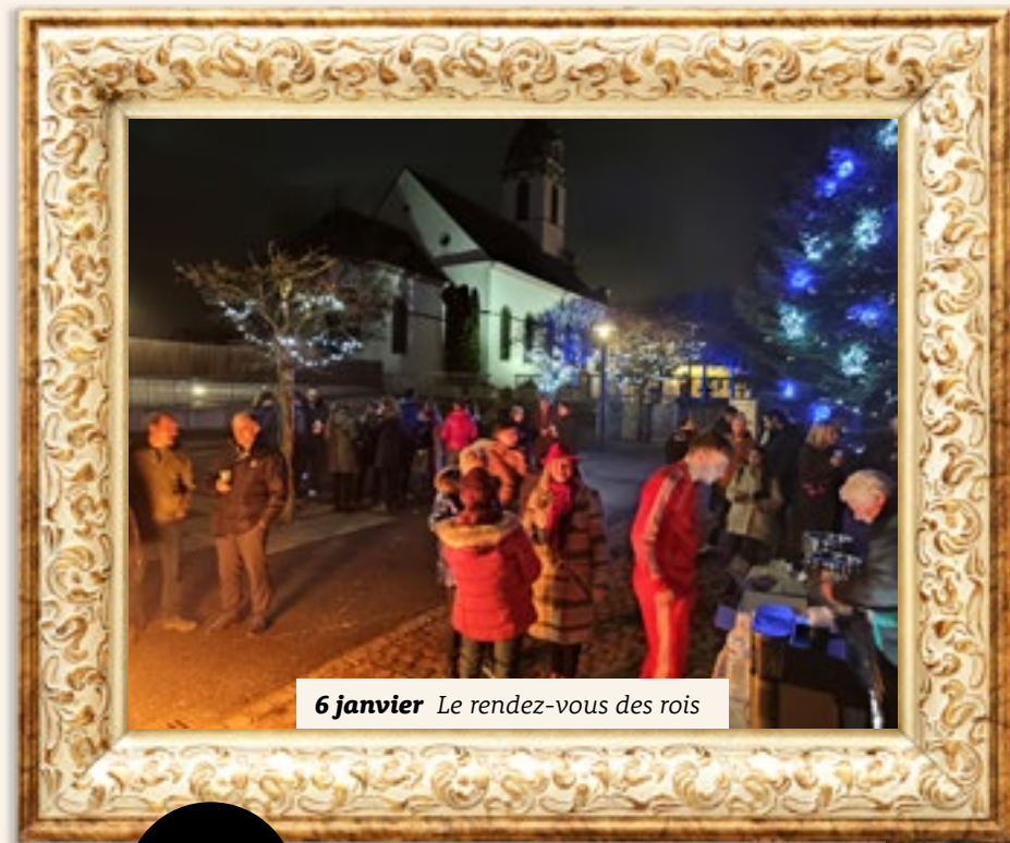
6 janvier Le rendez-vous des rois