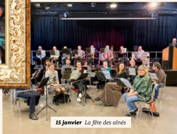
15 janvier La fête des aînés