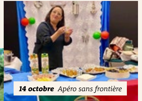
14 octobre Apéro sans frontière