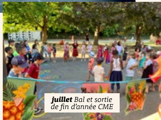
juillet Bal et sortie de fin d'année CME