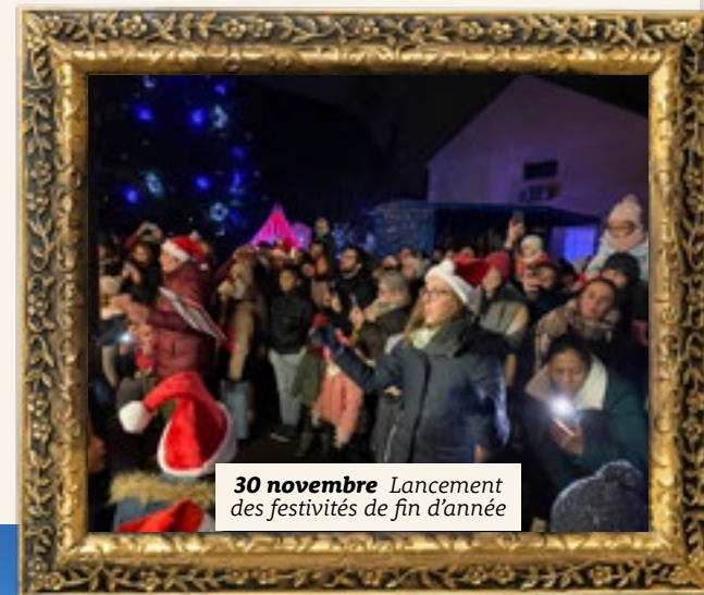
30 novembre Lancement des festivités de fin d'année