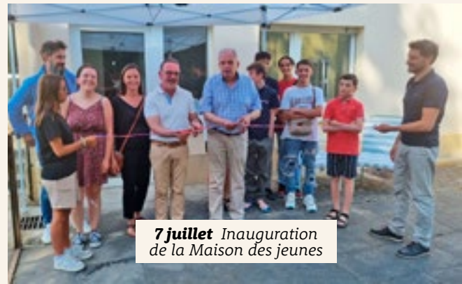
7 juillet Inauguration de la Maison des jeunes