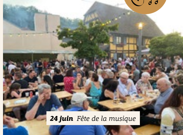
24 juin Fête de la musique