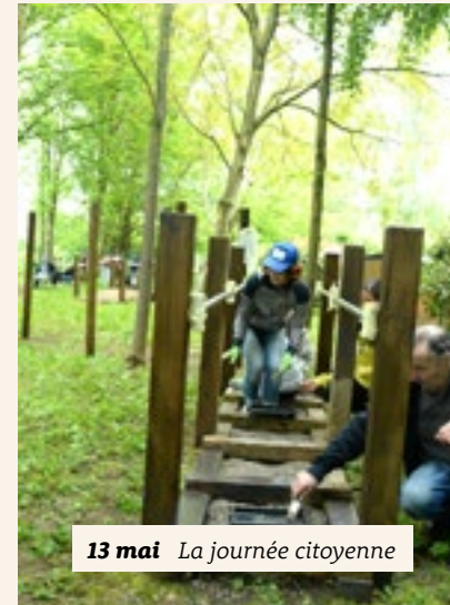
13 mai La journée citoyenne