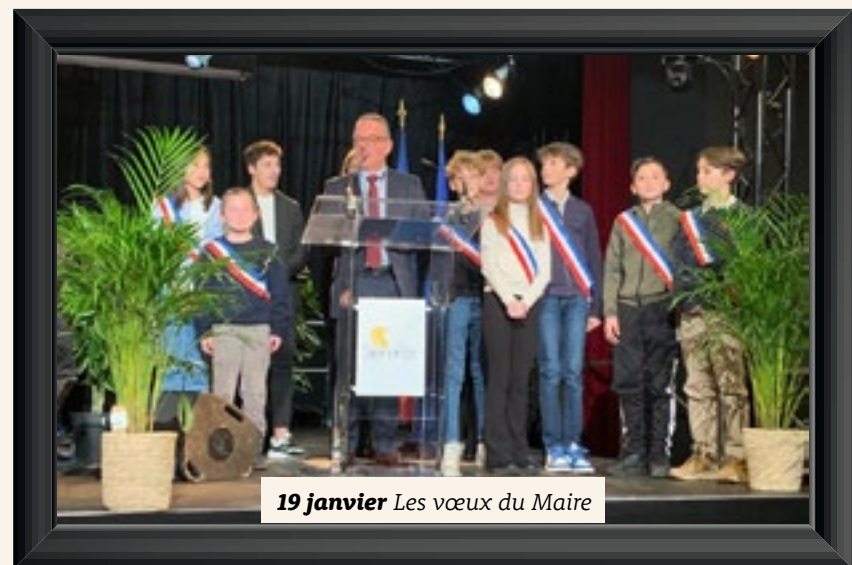
19 janvier Les vœux du Maire