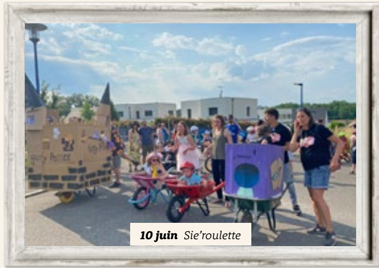
10 juin Sie'roulette