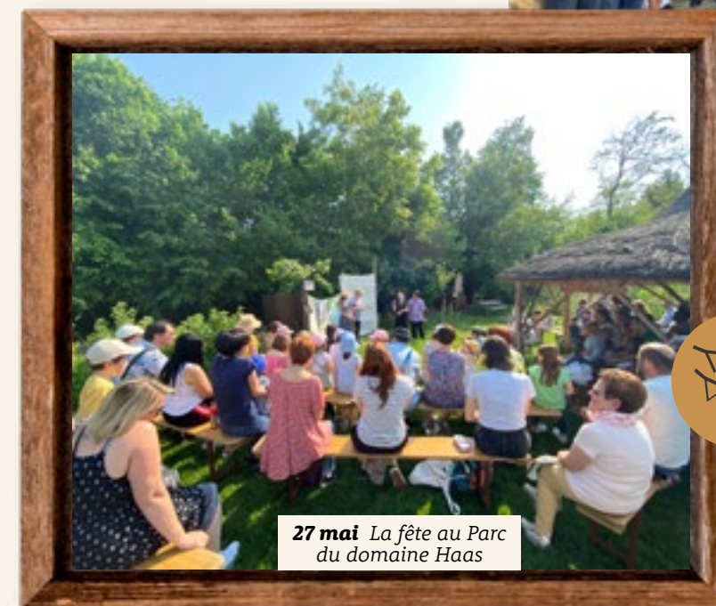
27 mai La fête au Parc du domaine Haas