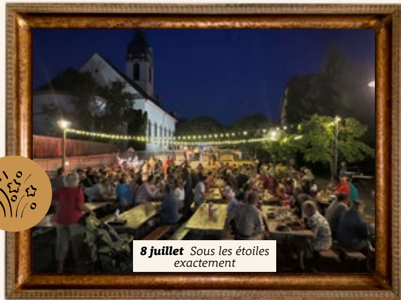
8 juillet Sous les étoiles exactement