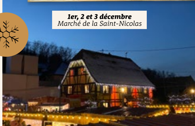
1er, 2 et 3 décembre Marché de la Saint-Nicolas