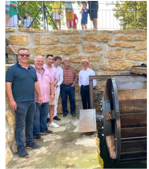
Inauguration de la roue