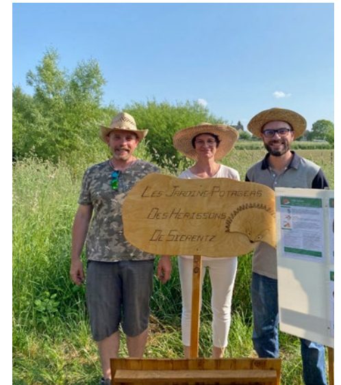
Les jardins potagers des hérissons